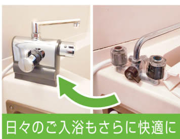
日々のご入浴もさらに快適に

使いやすい表示付きに変更し、天井の換気扇カバーや照明器具も一新しました。また、お施主様ご自身が依頼を遠慮されていたエアコンの撤去も行い、今後のために電源増設も同時に行わせていただきました。