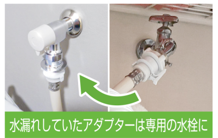
水漏れしていたアダプターは専用の水栓に

また壁紙処置の際、洗面台も取り外す必要があったため、取り付けなおす場合と、新しい物へ付け替える場合の比較をご提案し、新しい物と交換することに。スイッチ類も、工程上一度取り外さなければならぬので、