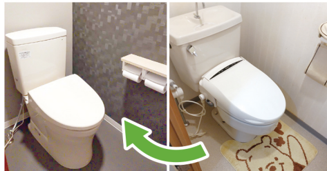
器具の不調が改善されて、より心地よい空間に

今気になる所と これから気になる所 一番のお悩みだったトイレは水栓を含め全面的にリフォーム同様に、調子の悪さや水漏れが気になっていた。台所と浴室、そして洗濯機用のものも全て新しく使いやすい器具に交換いたしました。